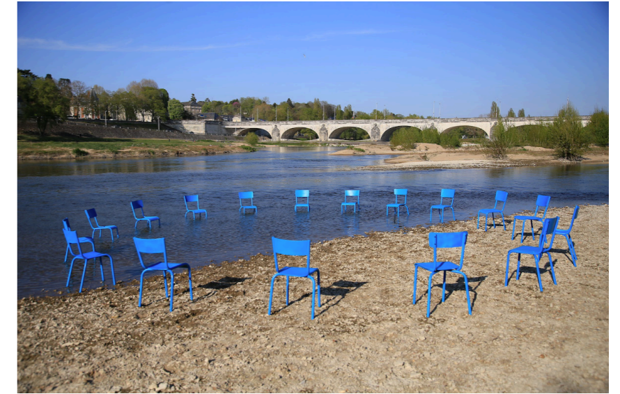
Camille de Toledo, "Le fleuve qui voulait écrire" -A partir des auditions du "Parlement de Loire"